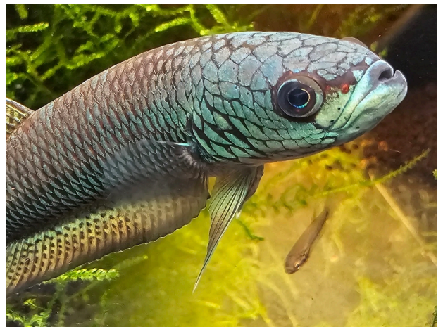
Mâle avec alevin..

De plus en plus de spécimens sont élevés en captivité, mais certains proviennent encore de captures sauvages. Pour éviter de contribuer à la disparition de populations locales, préférez les souches d'élevage . Et posez la question de leur origine au vendeur : un aquariophile curieux est toujours mieux vu qu'un client muet.