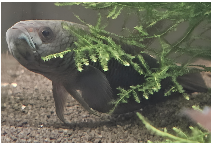
Mâle en incubation

Quand les alevins sortent, miniatures parfaites de leurs parents, il faut leur offrir des micro-proies ou de la poudre pour alevins. Si tout va bien, ils grandiront vite.